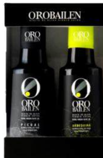
2 x 250ml