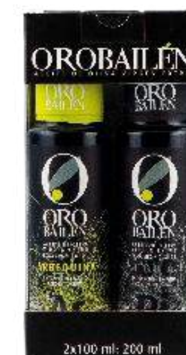
2 x 100ml