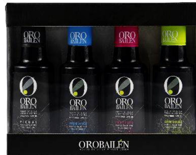
4 x 250ml