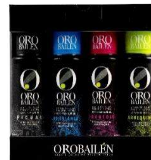
4 x 100ml